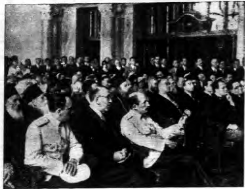
W Sofii odbył się kongres bizantologów, w którym wzięli udział wykładowcy państw europejskich...