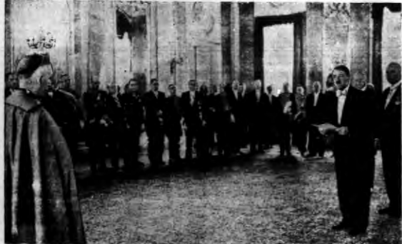
12 września przyjął Hitler korpus dyplomatyczny, do którego przynależało m.in. na lewo nuncjusz papieski monsignor Orsenigo.