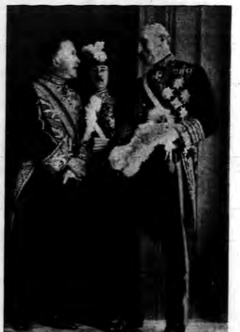
Posłowie Anglii, Francji i Włoch przy wejściu do pałacu.