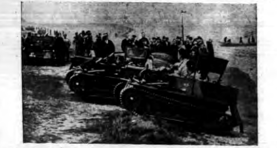
W ostatnich numerach angielskich udało się „nieprzyjacielowi” wydłubić w kilku miejscach na wybrzeżu Anglii i wydobyć tam małe tanki, zanim obrońcy zdążyli stawić opór.