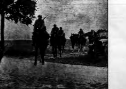
Kawaleria francuska w okolicy Valdahon na granicy szwajcarskiej.