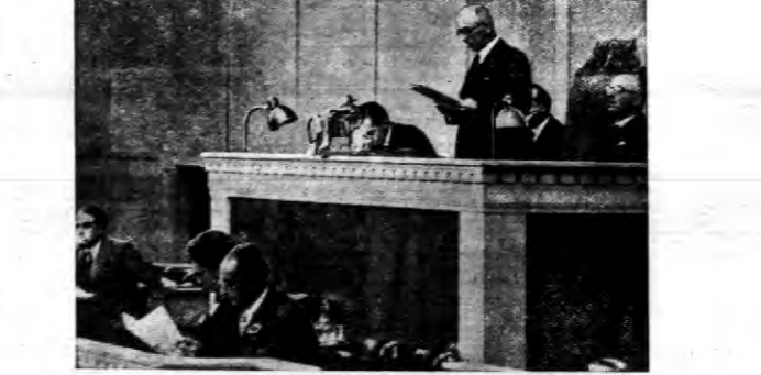
Czechosłowacki minister spraw Zagranicznych Beness w wielkiej sali otwiera posiedzenie...