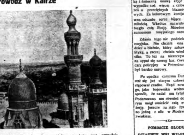
Widok na Kair, który spowodował wyjątkiem Nilu z brzegów, powołanie zagrożony jest powodzią.