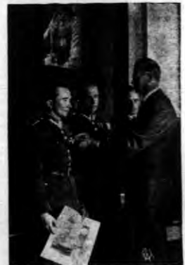
Dekoracja zwycięzców Challenge'u honorowymi odznakami L.O.P.P.