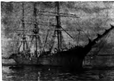
Polski statek szkolny „Dar Pomorza” wyruszył w uk. niedziela na całonocną podróż dookoła świata.