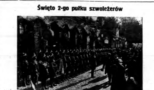
W dniu 17 września odbył się w Starogardzie w obecności Pana Prezydenta Rzeczypospolitej obchód 20-ty rocznicy istnienia 2-go pułku Szwoleżerów Rokitańskich. Na zdjęciu — szwadron honorowy 2-go p. szwoleżerów w szyku piechoty ze sztandarem 2-go p. Prezydenta w Starogardzie.

Wyniesiono zakwestjonowane towary WILNO. — Ze składni aptecznego użytkownicy przy ulicy Antokołkiej 50 wyniosła w nocy różne towary wartości 450 l. Skradziono towary jak się okazuje.