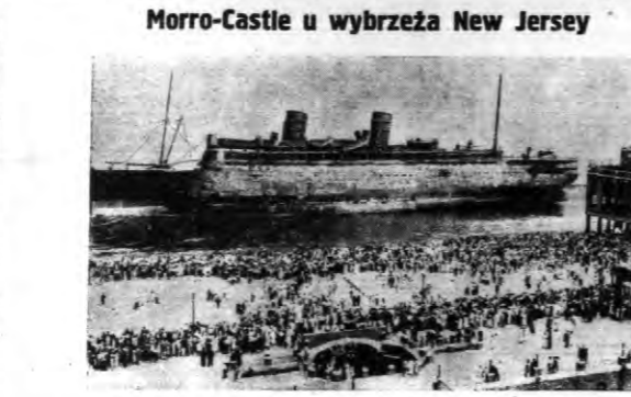
Wrak spalonego „Morrocasti” u wybrzeża New Jersey, gdzie przysiadają mu się tysiące ciekawych. Pożar tego statku kosztował życie okrago 170 osobom.

KOMUNIKAT TEATRALNO-KINOWY „FANNY” NA SCENIE W PIŃSKU. W dniu 21 września r. b. Teatr Polski im. Jul. Słowackiego na Woli... Komedja ta cieszy się obecnie wielkim powodzeniem na scenie w Teatrze Narodowym w Warszawie. Udział w przedstawieniu wzięli cały zespół teatralny.