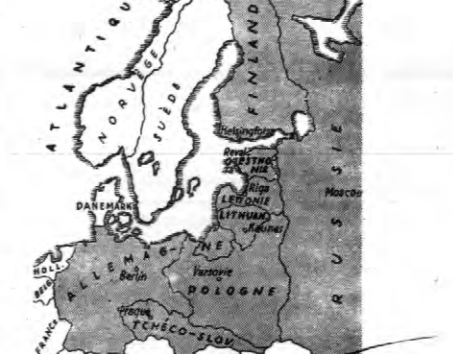
Wedle planu „Paktu Wschodniego” miałyby obejmować Polskę, Niemcy, Litwę, Łotwę, Estonię, Finlandię, Sowieci i Czechosłowację.