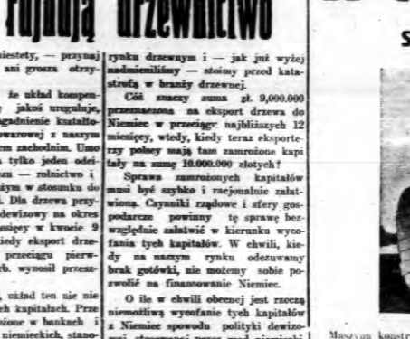
Maszyn konstruktor Bolani „Iris Hoop”... Ważniejsze koncerty, w których... Ważniejsze koncerty, w których...

Samolot, który ma pobić rekord australijski