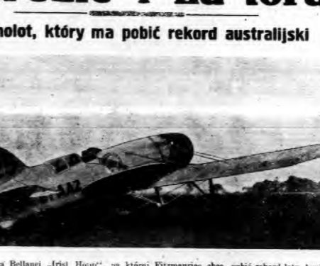
Maszyn konstruktor Bolani „Iris Hoop”... Ważniejsze koncerty, w których... Ważniejsze koncerty, w których...

Samolot, który ma pobić rekord australijski