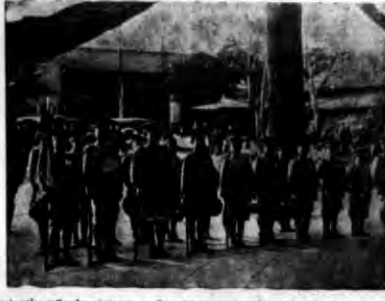
Członkowie Armii Achenon Dan Dzięcięcej Związku Patriotycznego do opuszczenia Sibiuku, gdzie złożył hołd bohaterom japońskim walk w Mandurji.