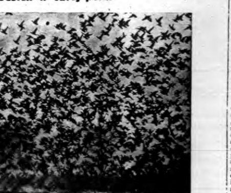
Sotki tysięcy ptactwa opuszcza północ... Ważniejsze koncerty, w których... Ważniejsze koncerty, w których...