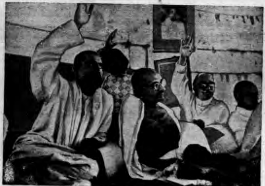
Oto głoszenie, które odbyło się podczas 48 kongresu narodowego w Indiach, mającego na celu postawienie Mahatmy na czele indyjskiej partii narodowej. Jak widzimy, Gandhi (w środku) przygląda się, jak wszystkie ręce podnoszą się za nim.