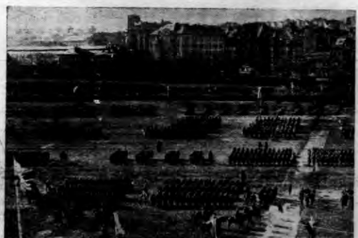
15 lat temu dzisiejszy regent Horthy na czele armii ochotniczej uwolnił Budapeszt i Węgry od rządów komunistycznych. Z tej okazji odbyły się na Węgrzech uroczystości połączone z paradą wojsk.