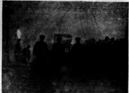
Onegdaj w dniu otwarcia parlamentu angielskiego, miał się odbyć uroczysty wjazd króla, który został odwołany z powodu mgły. Na zdjęciu samochód królewski poprowadzony przez policjantów dla uniknięcia wypadków, prze- jeżdża przez mgłę do gmachu parlamentu.