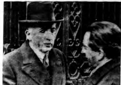
Stef nowego rządu belgijskiego Theunis w rozmowie z dziennikarzem.