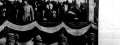
Zdjęcie z uroczystości 15-lecia wyzwolenia Budapesztu...