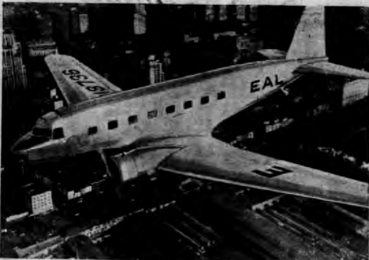
Amerykański lotnik wojskowy lut. Rickenbacker ustanowił swego rodzaju rekord lecąc na przedstawionym na naszym zdjęciu samolocie przez stratosferę, na przestrzeni Nowy York — Los Angeles.