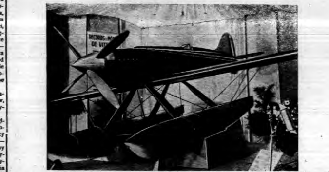
Największym eksponatem wspaniały wy-... (text continues)