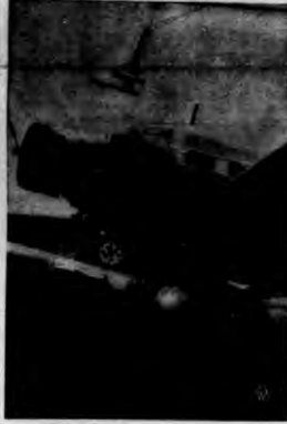
W Niemczech przeprowadzono ostatnio próby z nowym modelem samolotu, kierowanym automatycznie. Pilot puszcza jedynie w ruch motor, a potem kilka żabielnych ręków uruchamia automatyczny ster, który działa dalej automatycznie.