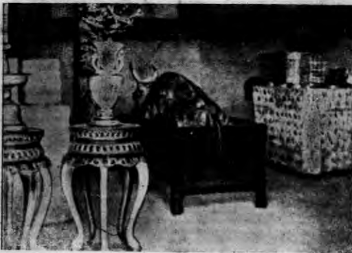
Po raz pierwszy od swego wstąpienia na tron opuścił cesarz Pary stółem państwa Mandlako, by świadczą groby swych przodków, którym złożył wołu na ofiarę.