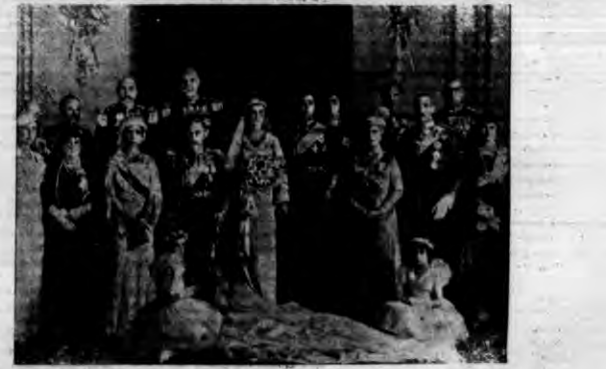
RODZINA KRÓLA ANGIELSKIEGO NA ŚLUBIE KSIĘCIA KENTU. W środku para narzeczonej, na lewo król Jerzy z księżniczką greką Nikoliją, matką narzeczonej i królową norweską Maud. Na prawo od króla Jerzego, królowa angielska - król Danii.