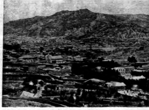
Głównie miasto Bolivijskiej La Paz, gdzie wodle doniesień zaplanowano, po ostatnich kłopotach z Pargajem zupełny chaos.