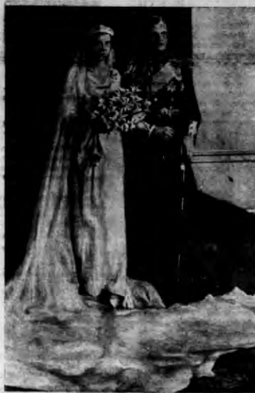
Pa ślubie wedle angielskiego i greckiego obrządku odbyło się śniadanie w Buckingham - Palace, gdzie dokonał na powyższym zdjęciu.