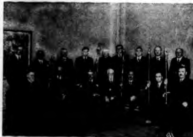
Senat Uniwersytetu Karola w Pradze ze słynnymi insygnjami, odebranymi od Uniwersytetu Niemieckiego, na krótko do niego zatargu.