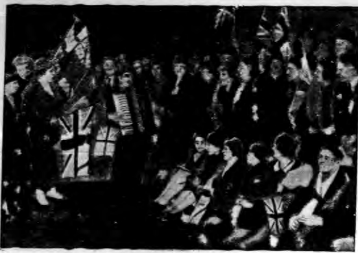
Już o północy przed wroczystością ob sadzali tłumy ulic, ktorými przejeżdżał mial orszak ślubny.