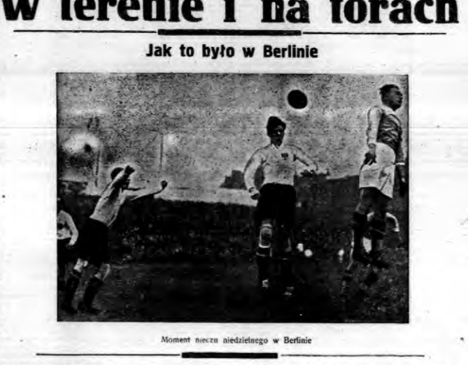
Walczyki w Warszawie. Moment meczu niedzielnego w Berlinie