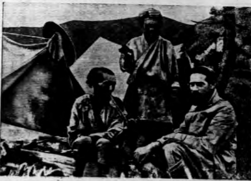
Mni si zakonu św. Bernarda przybyli do Tybetu. Zamierzają oni prowadzić w Himalajach swe dzieło misyjne...