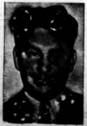
Amerykański lotnik transoceaniczny Willey Post, jedynki posiadacza rekordu w locie samolotu światła...