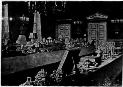
Prezenty dla Księstwa Kentu