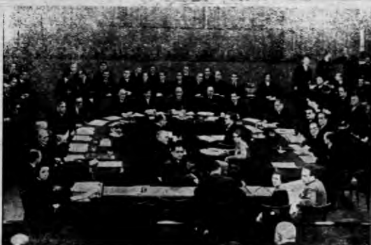
W czasie posiedzenia.