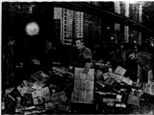
Stosy paczek w jednym z berlińskich urzędów pocztowych, przygotowane do dalszej ekspedycji.