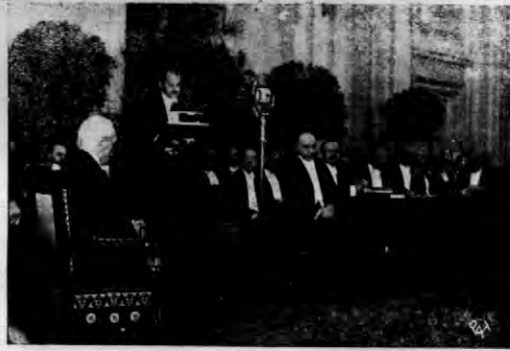
Polski świat naukowy a z nim cała Polska złożyła na uroczystej akademii w Politechnice Warszawskiej głęboki hołd Panu Prezydentowi Rzeczypospolitej z okazji 30-letniej rocznicy Jego pracy naukowej.