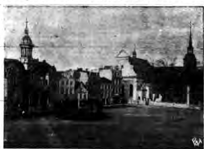
Słotca powiatu morskiego, drugie największe miasto polskiego powiatu Ojny, Wejherowo wchodzi w okres jubileuszowy 300-lecia swego istnienia. Miasto założone zostało przez wojewodę Jakoba Wejhera w 1634 r. Wojewoda Wejher był znanym wykonawcą planów morskich króla Władysława IV. Miasto słynie jako największe miasto odpostrawie diecezji chełmińskiej i zwane jest nawet „Kaszubską Częstochową” z racji posiadanych kaplic kalwaryjskich, ufundowanych również przez Jakoba Wejhera oraz Radziwiłłów.