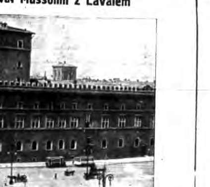
Palazzo Venezia w Rzymie, miejsce pracy Mussoliniego, gdzie prowadził pertraktacje z francuskim ministrem spraw zagranicznych Lavalem.