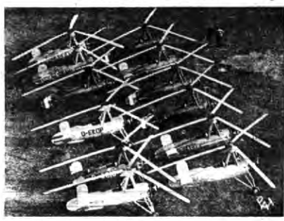
Dość niezwykły widok przedstawiają te samoloty — autogiro, ustawione w szyku rządowym na lotnisku w Feltham w Anglii. Samoloty te zostały wykonane na zamówienie różnych krajów. M. in. jak wiadomo jeden samolot tego typu nabrył został także przez Polskę.