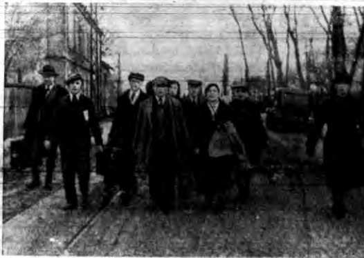
Szereg emigrantów, separatystów i komunistów opuszczających Zagłębie Saary, jednakże Francuzi poddają ich na granicy szczegółowej kontroli paszportów.