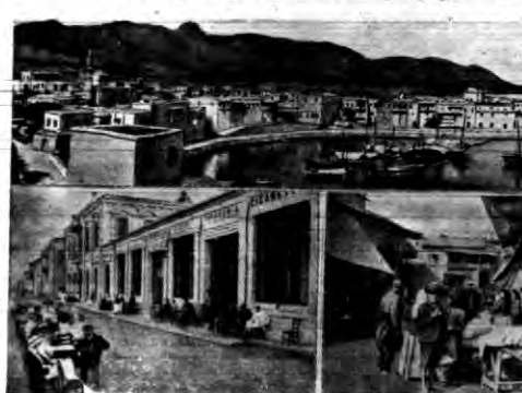
Obrazek z Cypru, gdzie projektowany jest plebiscyt. Wyspa pozostaje jak wiadomo pod rządami angielskimi.