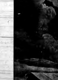
Dłatec zdjęcie lawiny śnieżnej w Alpach.