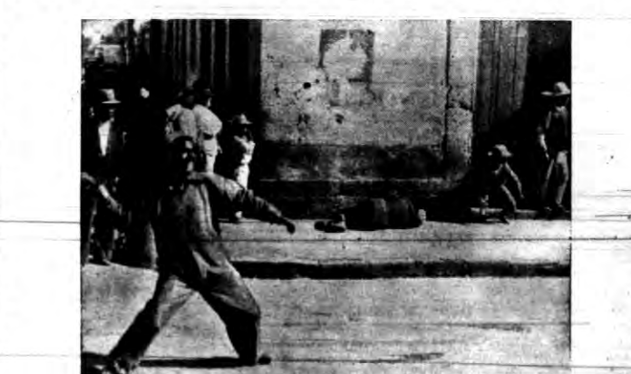
W Meksyku trwają stale walki między religijnymi, w których biorą udział nawet dzieci, jak na to wskazuje nasze zdjęcie.