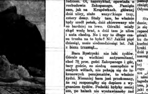
Dłatec zdjęcie lawiny śnieżnej w Alpach.