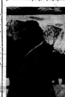
Marszałek za trumną siostry

chalkiewiczza, oraz licznego duchowieństwa. W krzesłach zajęła miejsce najbliższa rodzina Zmarłej, oraz dostojnicy, przybył z