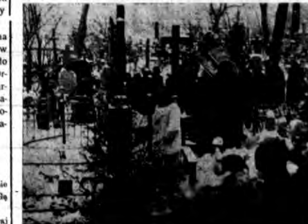
Na starym, Bernardyńskim ementarnu