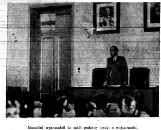
Mosulini wprowadził do szkół godzinę nauki o wojskowości.