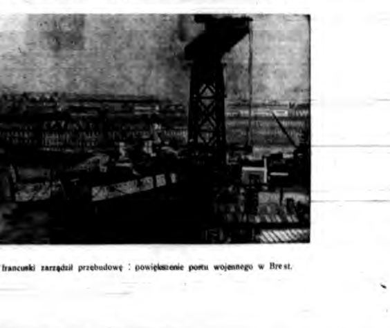
Rząd francuski zarządził przebudowę i powiększenie portu wojennego w Brest.