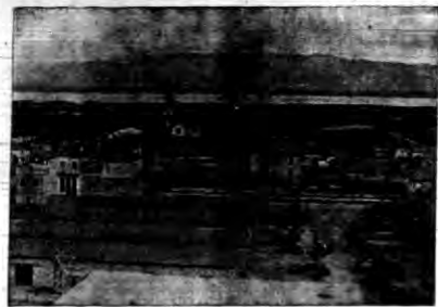
Jeden z widoków powstającego na osuszonych błotach Południowych miasta Littoria, które otwarto 6 dni przed początkiem sezonu.