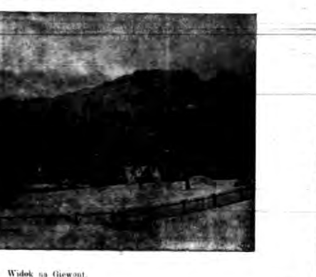
Wielok na Giewon.