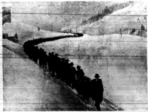
Wśród tłumnego udziału ludności odprowadzono do grobów zwłoki siedmiu ofiar lawiny w St. Antonien w Szwajcarii