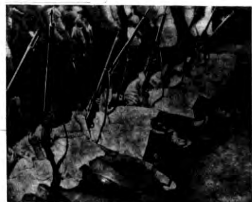
Wielkie związki powstające w Japonii dla obrony państwa szkolą także kobiety w dziedzinie wojennej. Na zdjęciu — japońskie dziewczęta uczące się strzelać do samolotów.