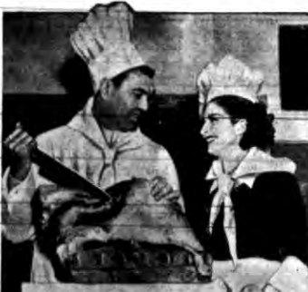
Jack Dempsey amerykański b. mistrz świata w wadze ciężkiej w boksie, w rol kucharza w swej własnej restauracji. Obok jego żona, b. aktorka.