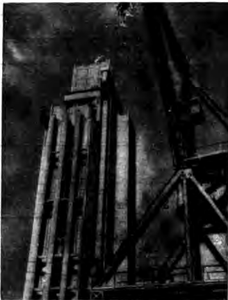
Przy wejściu do portu w St. Francisco, t. j. „Złoty bramej” powstał ma jedna z największych budowli jakiegokolwiek projektu. Zostanie tu budowany największy wiszący most świata, nad „Złotą bramą”. O rozmia- rach tego mostu daje wyobrażenie jedna z wień podtrzymująca łuny, na k6- rzych zawiesznie most.