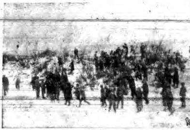
Dzielnia kaszubska ze szkoły w Wielkiej Wsi — Tallentow — wycieczka naukową w wydmach otwartego Bałtyku. Zdjęcie przedstawia obserwację roślin wydmowych, po ostatnich mrozach jak nieprzeżyte w tej części wybrzeża polskiego, w dzień otwarty widok na morze.