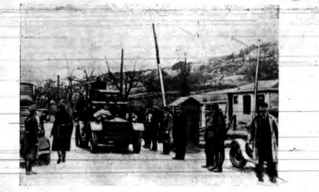
Angielskie samochody pancerny na granicy Zagłębia.