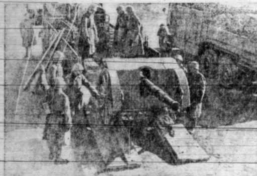
W Czeskosłowacji motoryzacja armji czyni znaczne postępy. Jak widzimy na zdjęciu, działa wieżowe się — jak daleko się da — na samochodach ciężarowych, a półtora tona uniemożliwia dalszy transport — na samocho- dach ciężarowych.