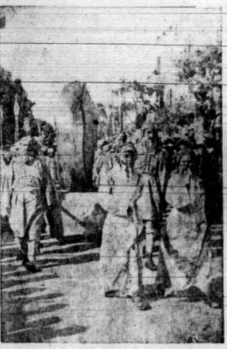
Przebieg pochodu kar karnawalskiego w Tel - Aviwie.