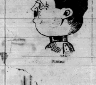
Dziś i jutro