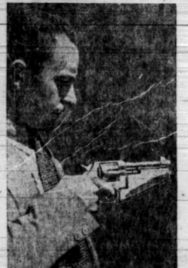
Konstruktorzy w Hollywood udało się zbudować najmniejszy aparat fil- mowy na świecie, podobny do pistoletu i wprawiany w ruch za pomocą kurka.