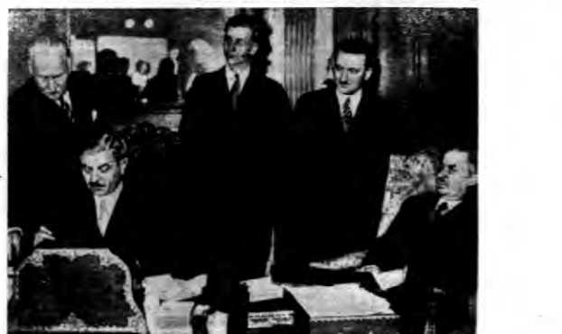
Podpisanie paktu aliansu franko-sowieckiego...