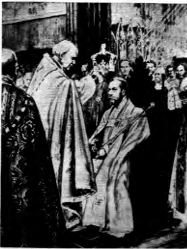
Powysze zdjęcie przedstawia moment koronacji króla Jerzego V...