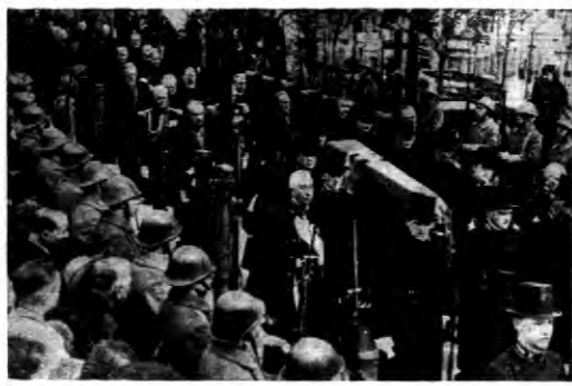
W Holandii odbył się uroczysty pogrzeb nuncjusza papieskiego monsignora Lorenza Schoppa.