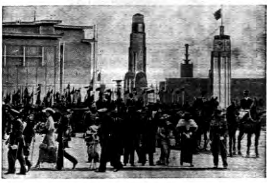
Belgijska para królewska wiedziana wystawą.