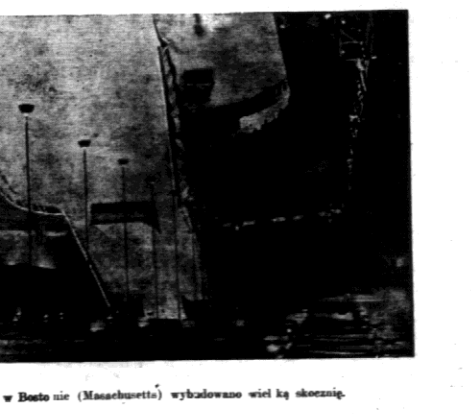
Na wielkiej arenie sportowej w Bostonie (Massachusetts) wybalowano wiek ką skoczni.