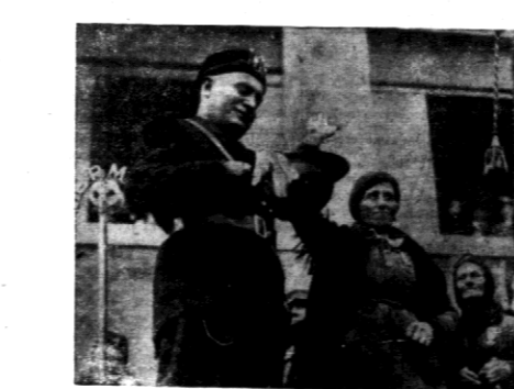
Mussolini agituje za układaniem słoty ch obrączek, na rzecz włoskiego skarbu państwa.