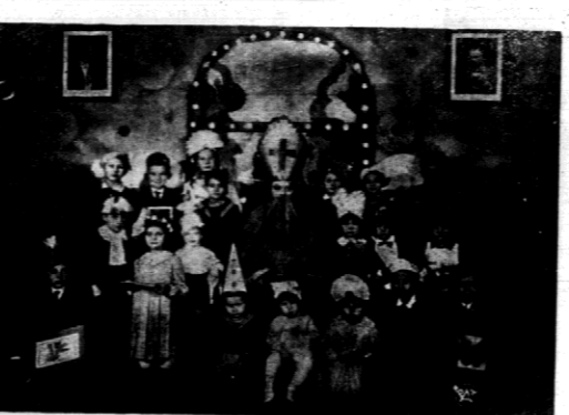
Od paru lat w Płocku wskrzeszono jst prastary polski zwyczaj obchodu św. Mikołaja, patrona dzieci. Zwyczaj ten wprowadził Miejskowy Związek Pracowników Miejskich, urządzając w swej świetlicy tradycyjny obchód.