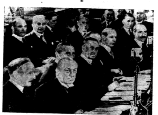
W Londynie otwarto konferencję w sprawach floty, w której biorą udział Anglia, Ameryka, Japonia, Francja i Włochy.