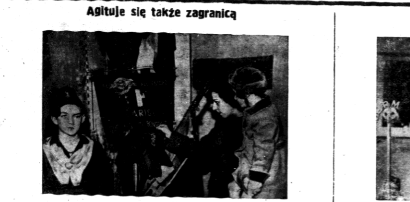
Włoska ofiarowująca w Paryżu obrączkę na rzecz włoskiego skarbu państwa.