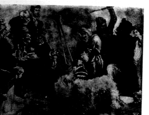
Podjęmy rycinę niezłomnego otwórcy zanikających zwyczajów i obyczajów polskich Andriollego przed stawiającą ucieczkę ligie kolendniców