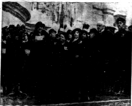
Propaganda wojny we Włoszech doprowadziła do tego, że królowa ofiarowała pierwszą swą obrączkę, z odpowiednim przeniesieniem nad grobem Nieznanego Żołnierza.