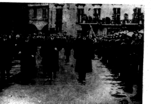
Nowowzrany prezydent Republiki Czechosłowackiej dr. Benes po posiedzeniu zgromadzenia narodowego w dniu 18 bm. przeobraził w towarzystwie premiera Heblly przed frontem kompanji honorowej