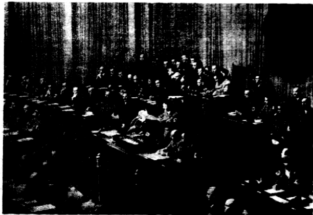
Kancelier Hitler przemawia