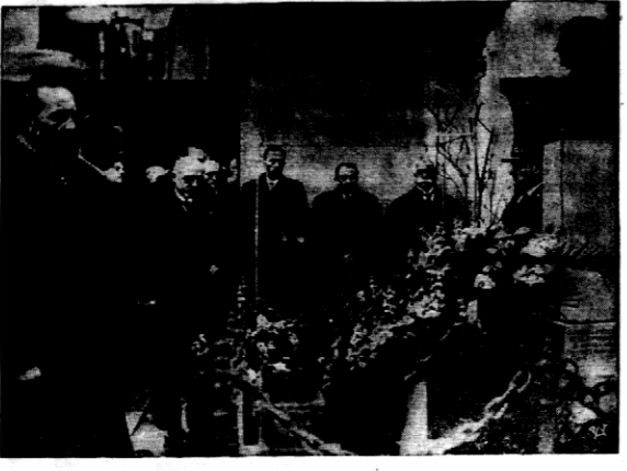
Zdjęcie nasze przedstawia fragment wyroczni z udziałem przedstawicieli miejscowego społeczeństwa...