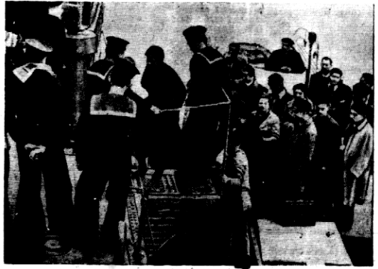
Uciekinierzy hiszpańscy, zabrani przez okręt angielski, wysiadają na ląd w St. Jean de Luz (Francja poł.).