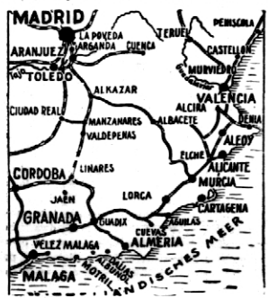
SITUACJA NA FRONCIE POŁUDNIOWYM W HISZPANII.

TALAVERA DE LA REINA. Pat. która obecnie znajduje się już pod ogniem artylerji powstańczej. Wojska musiały zatrzymać się w tym miejscu, aby umocnić zajęte tereny. Artylerja i lotnictwo biorą w akcję niewielki udział, natomiast czyn panujących nad tą miejscowością, nie są w Varis Madryt i Chinchon.