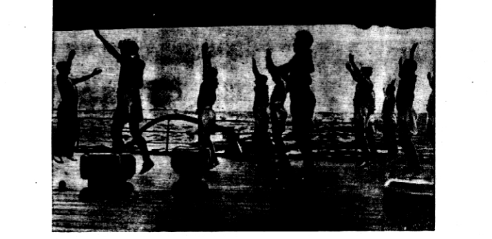
Niejeden żyłoby sobie może takich ćwiczeń, wykonywanych przez 350 chłopców okrętowych na pokładzie angielskiego okrętu wojennego „Royal Sovereign”