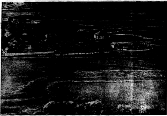
W Anglii powódź przybrała również wielkie rozmiary. Na zdjęciu zalany obszar w Berkshire.