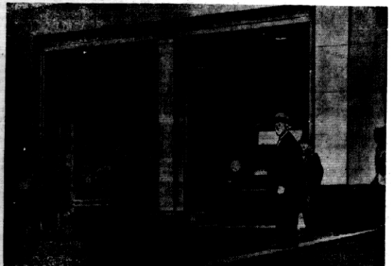
Skarbiec Stanów Zjednoczonych został przeniesiony do fortu Knox w Kuentepcy, okąd obecnie odbywa się prze-wożenie zapasów złota. Na zdjęciu — pierwszy transport złota w samochodach pancernych, pod konwojem —