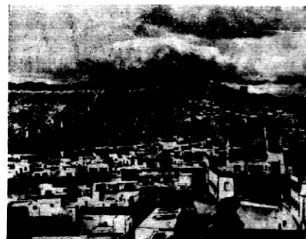
Żołnierze przedawia widok ogólny hiszpańskie, o miasta Almeria, pod które zbliżają się wojska powstańcze gen. Franco, po zajęciu Malagi.

LONDYN. Pat. Po dyskusji komitetu nieinterwencji Jednomyślnie PRZYJĄŁ ZALEZENIA PODKOMITETU O WPROWADZENIU W ŻYCIĘ W NOCY Z 20 NA 21 LUTEGO ZAKAZU WYJAZDU OCHOTNIKOW, A KONTROLI W NOCY Z 5 NA 6 MARCA, z tem jednak, że uchwały te prześlane będą odfinansowaniem z ostatniej aprobaty.