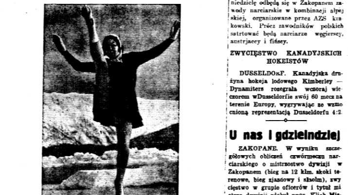
Jedną z Sani Henie najlepszą z był wiarę...