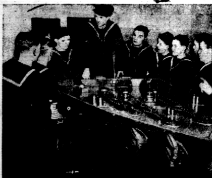
Obrazek z angielskiej szkoły marynarki w Shearn, w hrabstwie Kent.