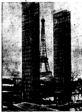
Jedno z głównych wejść na wystawę światową Porto de l'Alma. Na tle wysokich wież, wieża Eiffa.