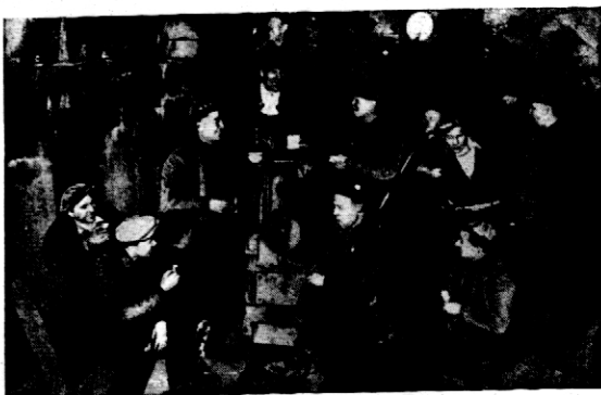
W Chicago zastrajkowali robotnicy pracujący w tunelach, w następstwie czego duże zapasy środków żywności dostracane temi tunelami, nie dostały się do konsumentów i uległy zniszczeniu.