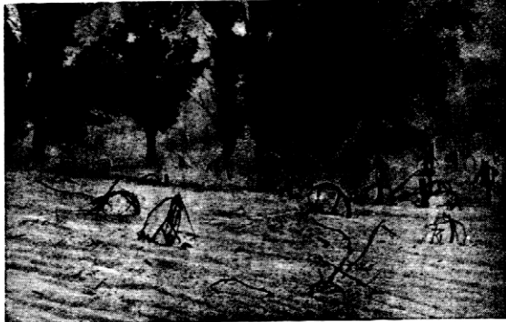
Wskutek wzmocnienia drzewostanu w Kalifornii, powtarzają się tam ostatnio burze piaskowe, zmieniające piękny i żyzny kraj w pustynię. Na zdjęciu okoliczność burzy w południowej Kalifornii, w pobliżu San Bernardino.

W dzielnicy paryskiej Cligny doszło do krwawych starć między policją a komunistami i marksistami. Po obu stronach uciekono użytek z broni palnej. Dotychczas jest czterech zabitych i około 300 rannych.