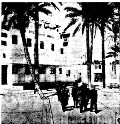
Na zdjęciu naszym Mussolini widać woskie instytucje higieny i zdrowia w Trypolisie.