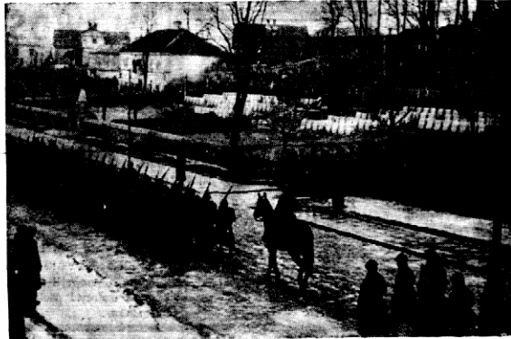
Zdjęcie przedstawia fragment z defilady wojsk, która odbyła się w dniu 19 marca, jako w dniu imienin Marszałka Józefa Piłsudskiego, przed Mauzoleum na emmentarzu Rossa, gdzie poczywa Serce Wielkiego Marszałka. Przy płycie Mauzoleum ustawili się sztandary organizacji h. wojskowych, społecznych, akademickich i szkolnych.