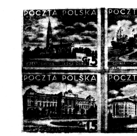
Z dniami 1 kwietnia b. r. ukazały się nowe znaczki pocztowe... znaczki...