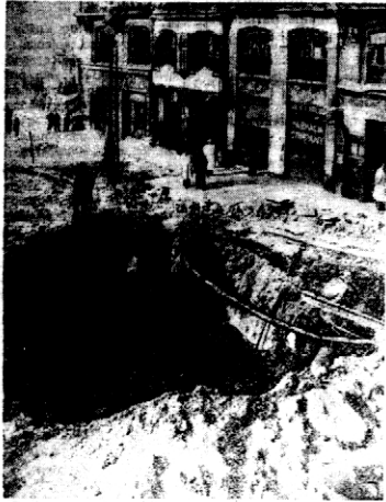
Zdjęcie nasze przedstawia fragment z centrum Madrytu, po bombowym ataku lotniczym wojsk powstańczych.

OGŁOSZENIA: wiadomości 1-szpaltowy w tekście 40 gr. Za tekstem 30 gr. Komunikaty oraz nadesłane mi- liniatury 50 gr. Kronika reklamowa milimetr 80 gr. W zamkach świętych 100 gr. z prowizją 20 proc. drożej. Zagran- iczne 60 proc. drożej. Ogłoszenia cyfrowe i tabelaryczne 250 proc. drożej. Układ ogłoszeń w tekście 1 za tekstem 6-szpaltowy. Administracja nie przyjmuje zastrzeżeń od domościan. Terminy druku Administracji nie obowiązują.