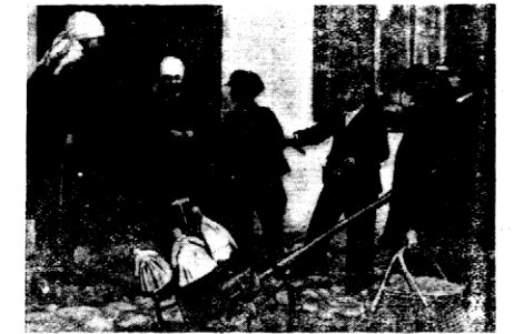
Staropolskie zyczące wielkanocne w Łowiczu... zdjęcie...