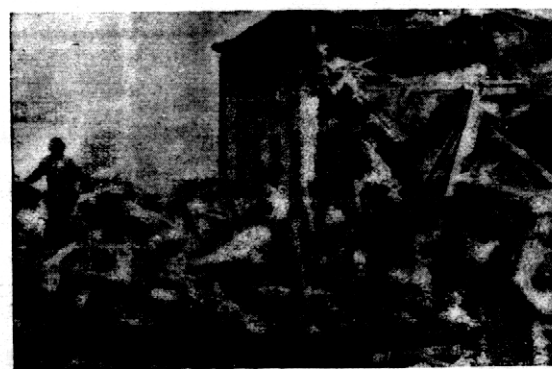
Jak podawali nastąpiła w szkole miasta New London, w Texas eksplozja gazu, przyczem zginęło 500 dzieci. Na zdjęciu wydobywanie trupów z pod gruzów.