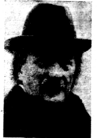
Oni donoszą z Zarihu, zachorował tam na grupę mistrz Paderewski. Stan zdrowia wielkiego pianisty, z pewnością obawy