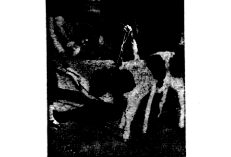
W Niemczech urodziło się ciele o trzech ogonach, potem zupełnie normalne