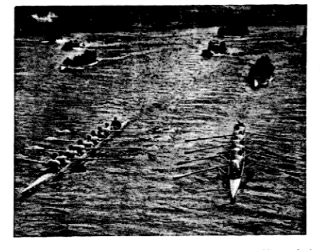
Oczek tradycyjnego wyścigu ósemek Oxford — Cambridge, zakończony — jak wiadomo — zwycięstwem Oxfordu, który na zdjęciu zdecydowanie prowadzi.