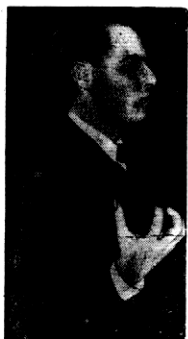
Leon Degrelle, przewodca reksistów

tyk starej generacji, człowiek o dużych walorach, jest on przedstawicielem partii katolickiej i to było najsprytniejszą sztuczką koalicji antyreksistowskiej, że nie wystawiła żadnego socjalisty, żadnego liberała, ale właśnie katolika.