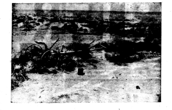
Barza piaskowa, która przeszła przez niekrotne stany USA zamilniała w pustynię żyzne pola pszenicy...