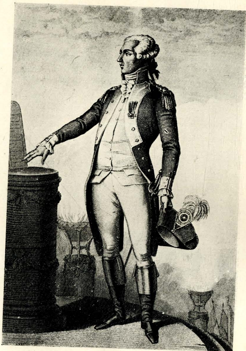
LE GÉNÉRAL LA FAYETTE