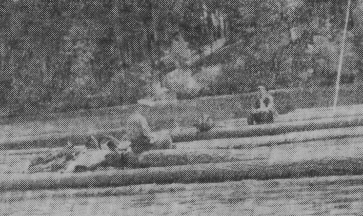
Setki tysięcy ton drewna spławia się codziennie po kanałach i jeziorach Augustowskich...