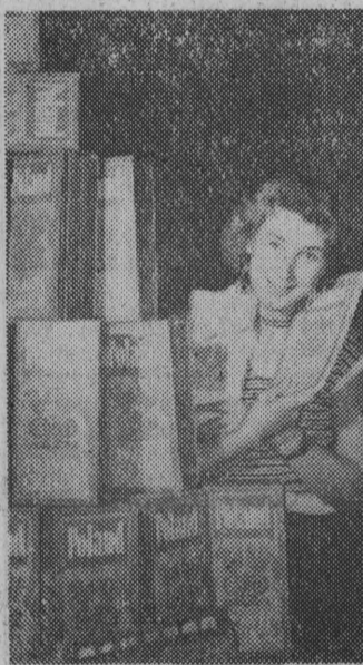
Przed kilkunastoma dniami opuścił prasę Łódzkiej Zakładów Graficznych ogólnokrajowy przewodnik turystyczny po Polsce. Liczy on 1000 stron tekstu. Przewodnik obejmuje wszystkie regiony Polski. Pierwszy nakład w języku angielskim w wysokości 5000 egzemplarzy sprzedany został w Anglii. W przygotowaniu są wydania w języku niemieckim i francuskim.

rzucenia pracy przez koleja- rzy. Według pierwszych do- C. d. na str. 2