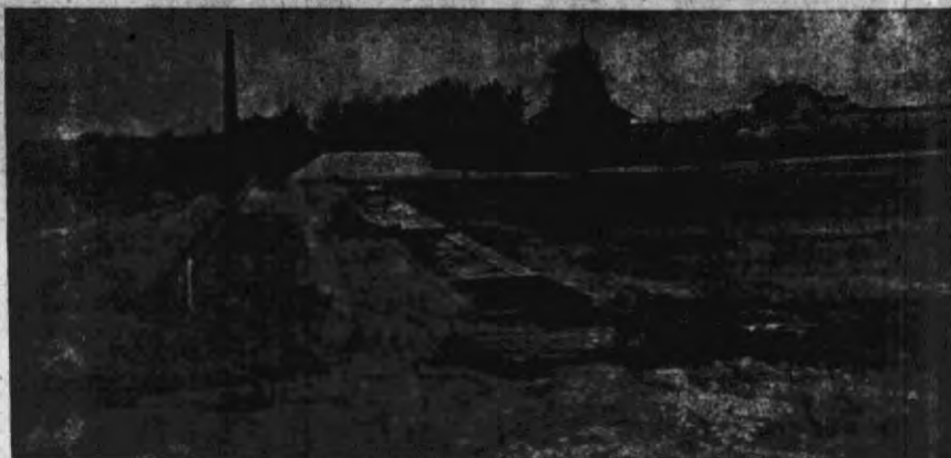
Widok stadionu sportowego w Złoczowie.