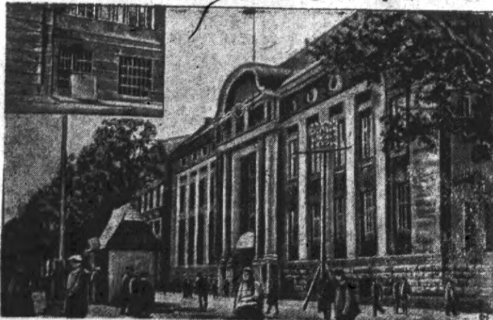
Gmach Banku Handlowego w Łodzi, w którym 2 dni temu dokonano znanego Czytelnikom napadu rabunkowego.