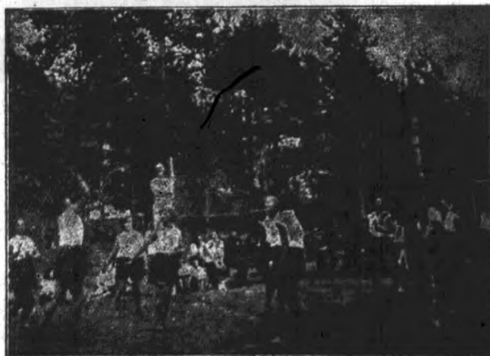
Gra w siatkówkę w obozie letnim kobiet, prowadzonym przez Urząd Okręgowy P.W. i W.F. w Grodnie.