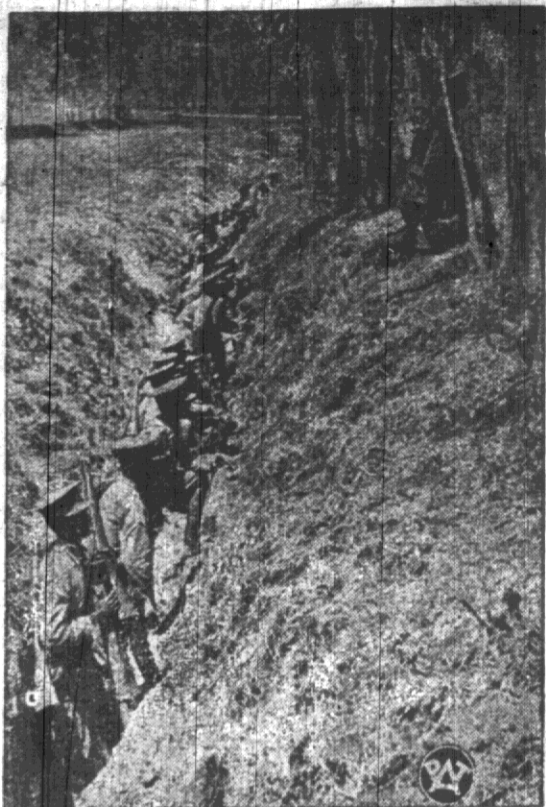
W okopach. Piechota abisyńska umundurowana i uzbrojona do europejsku.