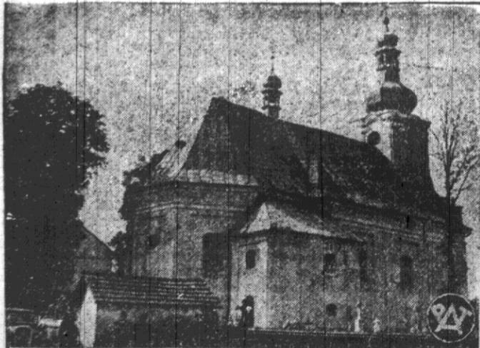
Kościół w Cierlicku, miejscowość pamiętnej przez tragiczny zgon kpt. Żwirki i inż. Wigury. Pomimo, iż parafia ta jest niemal całkowicie polska, władze czeskie ostatnio mianowały tam proboszcza Czecha.

Szykany władz czeskich w stosunku do ludności polskiej wywołują najwyższe oburzenia całego społeczeństwa polskiego. Ostatnio 90 towarzyszy i zrzeszeń społecznych z Wielkopolski wydało wspólną odezwoę protestu, a przeciwko prześladowaniom mniejszości polskiej w Czechosłowacji i rozywającą do składania ofiar na rzecz pomocy kulturalnej