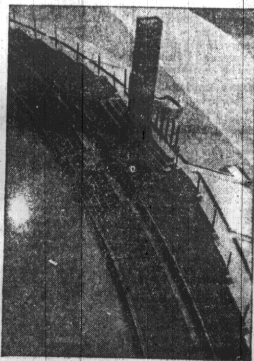
budowa stadionu olimpijskiego w Berlinie

— Legja, który po emocjonującym przebiegu zakończył się sensacyjnym zwycięstwem Warszawianki 2:1.