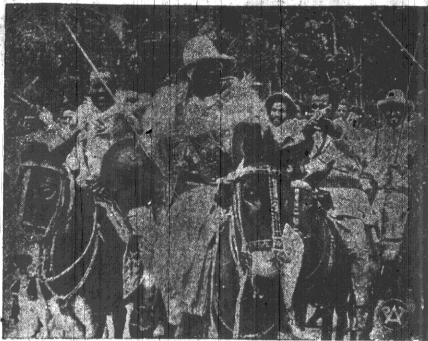
Wciąż jeszcze napływają do Addis Abeby nowe oddziały, sformowane z plemion zamieszkujących kraje państwa, aby poddać się rozkazom cesarza i spomóc walczących na froncie.

Każda dobra i skrzętna gospodyni wie doskonale o tem, że oszczędność w największym stopniu przyczynia się do skutecznego pokonania trudności jej budżetu domowego i dlatego też, jako paliwa, używa gazu, który kalkuluje się najtaniej.