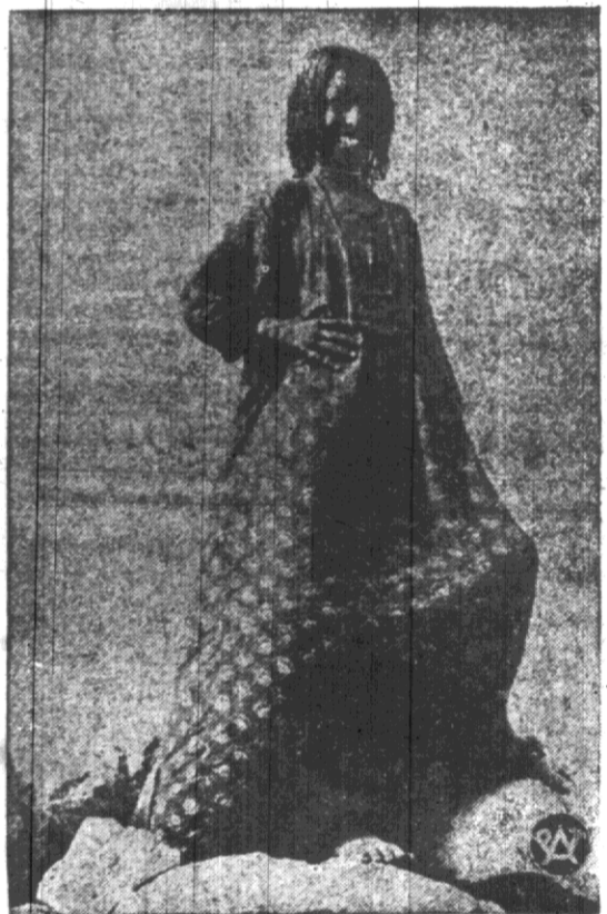
Piękna dziewczyna murzyńska z Assuanu. Włosy według mody miejscowej, jak wszystkie murzynki sudańskie ma zaplecione w mądźtroo drobnych warkoczycio i posmarowane tłuszczem wielbłądzim.