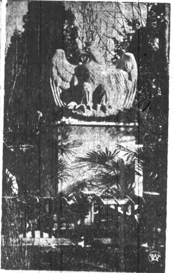
Pomnik poległych legionistów w Jablonkowie z napisem: „Bajonierom walk o Niepodległość”. Jak wiadomo, taki sam napis na szarfach wieńców, złożonych w dniu Święta Niepodległości przez harcerzy polskich w Czechosłowacji, uznany został za provokacyjny i harcerze zostali aresztowani