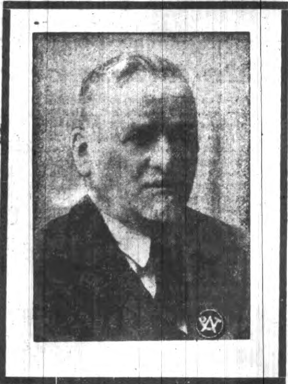
W Warszawie zmarł, jak donosiliśmy, po krótkiej chorobie senator Rzplitej, wiceprezydent m. Wilna i p. Adam Piłsudski, młodszy brat Marszałka.