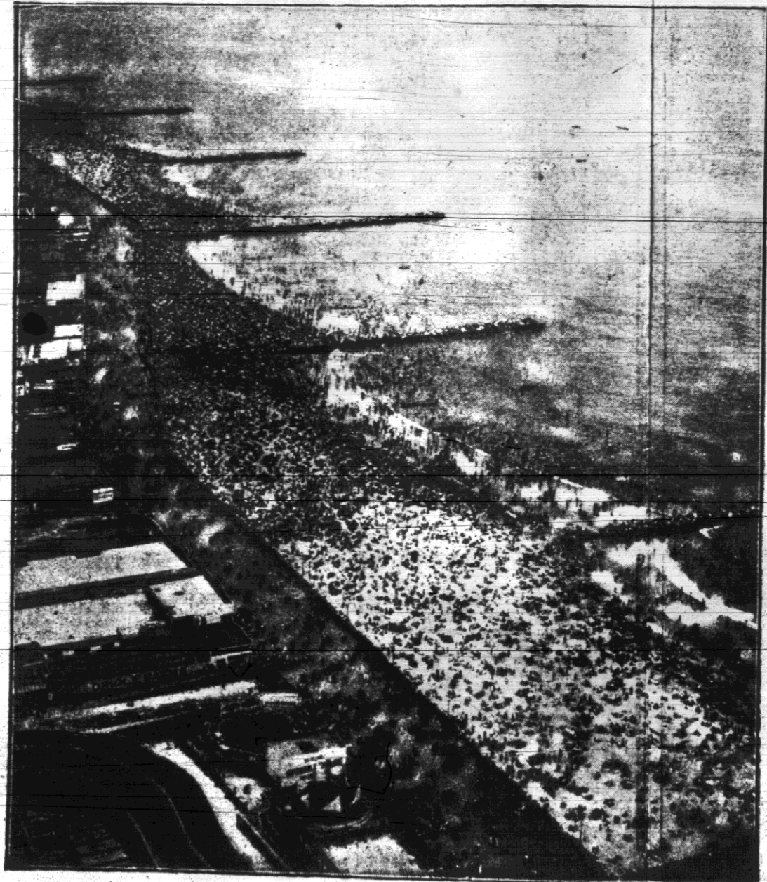
Tak wygląda wielka plaża w Miami na Florydzie, gdzie miljonery amerykańscy spędzają wakacje.