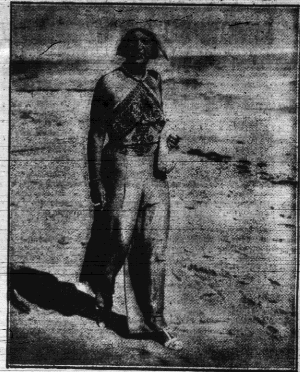
Na rozgrzonym piasku nadmorskiej plaży w Palm Beach (Floryda) paradujące panie używają kostiumów plażowych, złożonych ze spodni i jednej kolorowej chustki, niesternie związanej na piersiach, a odsłaniającej plecy.

Możeto rozczaruje Panią nieco, jednak na mój dowód zainteresowania musiałem odpowiedzieć z pełną szczerością.