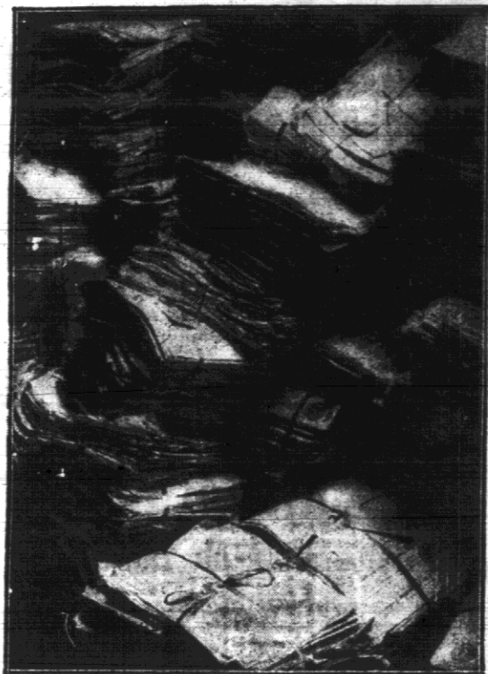
Z całego świata nadesłano do Genewy na konferencje rozbrojeniową miliony błagalnych próśb o pokój.