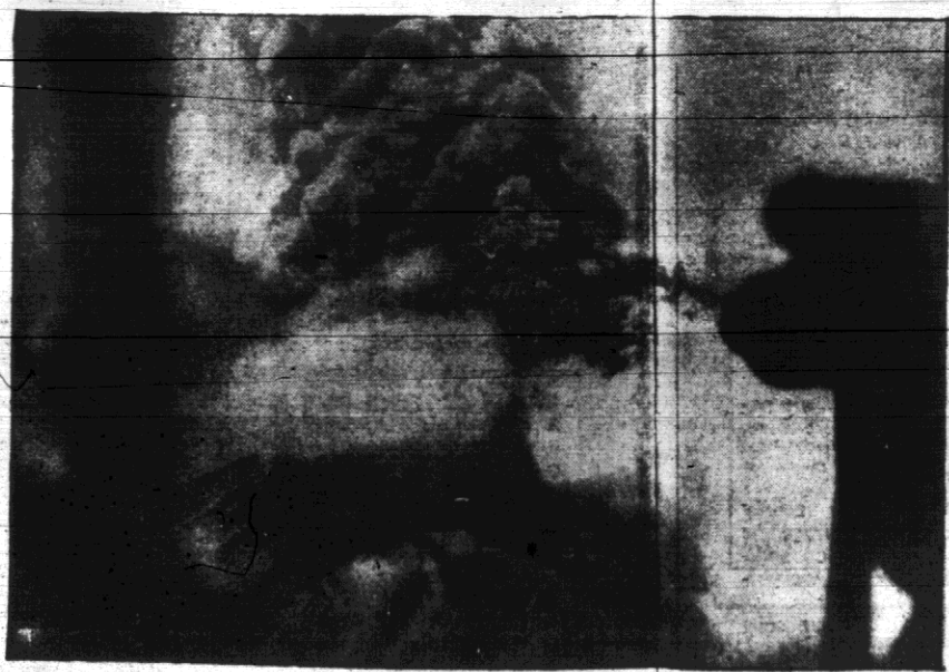
Pełen grozy widok wybuchu wulkanu Fuego w Guatemali (Ameryka Południowa), który zniszczył doszczętnie kilka miast.