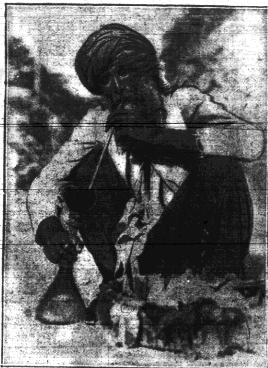
Wielki przywódca nieczynny, pałacy nargille. Jeden z wyzwalców Gandhiego, którzy metoda bojkotu i biernego oporu podważają potęgę Anglii na terenie Indyi.