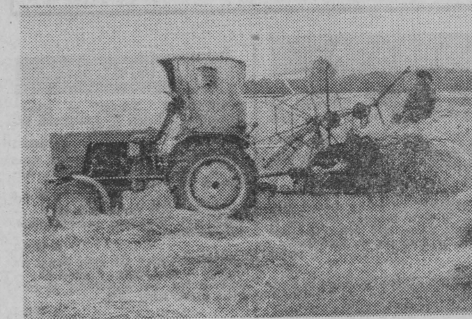
Awaria usunęta i można kosić dalej. Sprawnie, jak dotąd, przebiegają żniwa w gminie Ciechanowiec.