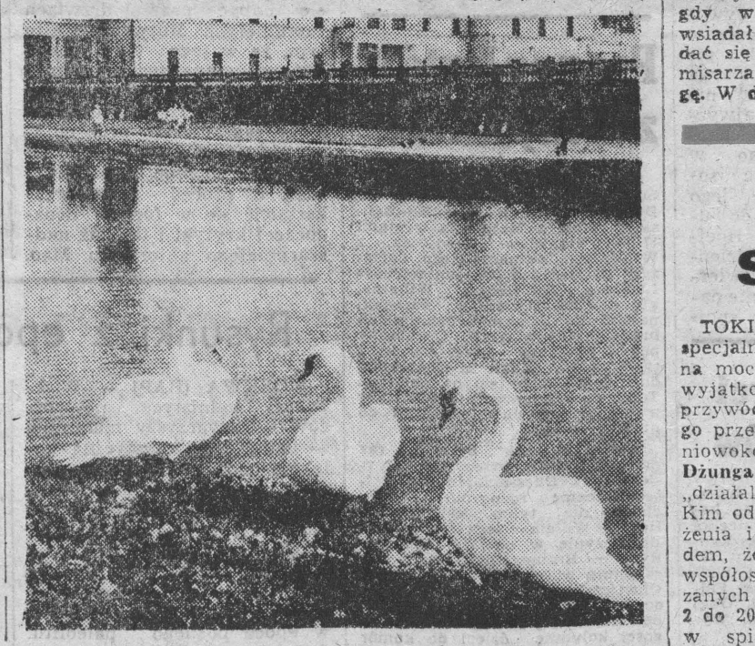
BIAŁOSTOCKIE PLANTY.