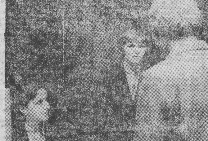
Oprócz ludzi kupujących i odbierających samochody, w salonie sprzedaży zastęga informacja wielu potencjalnych klientów.

Lepsze warunki pracy personelu, urządzenia sanitarne, radiofonizacja, poczekalnia dla klientów, telewizja przemysłowa, oto — szczegółowo wylizczając — efekty modernizacji. Wygospodarowano nawet miejsce na barek, urządzono go, tyle że jeszcze nie jest czynny. Do załatwienia pozostały drobne sprawy natury sanitarnej, które — miejmy nadzieję — szybko się zakończą.