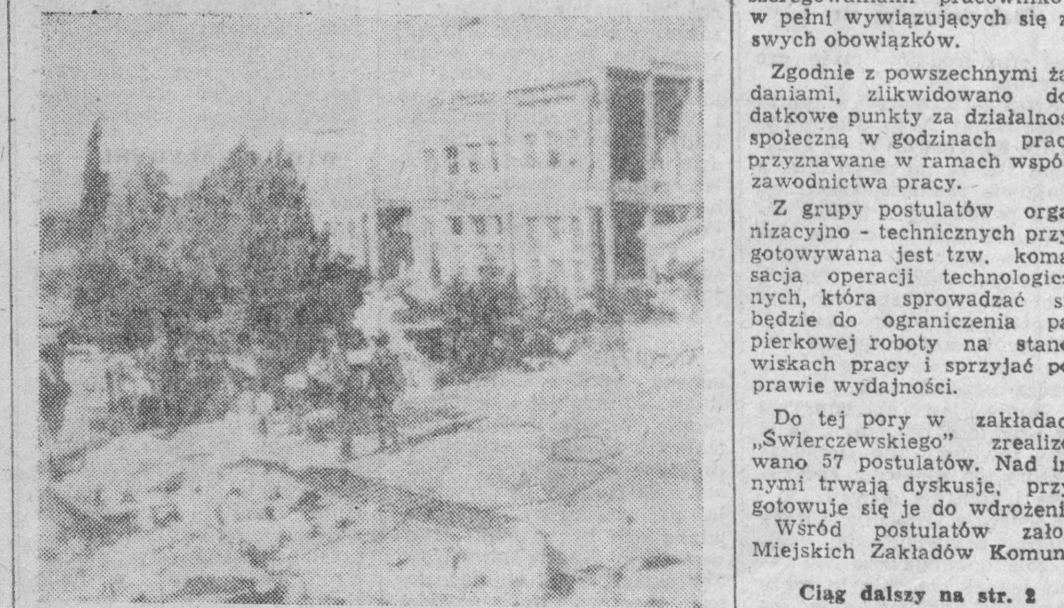
NA ZDJĘCIU: zniszczony wstrząsami hotel CHELIF w El Asnam.

WARSZAWA (PAP) — Jak donoszą korespondenci PAP, przedstawiciele załóg licznych zakładów pracy sprawują nadzór nad przebiegiem wdrażania postulatów robotniczych w życie.