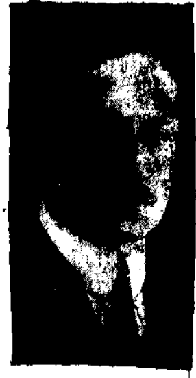
Minister finansów BOKANOWSKI