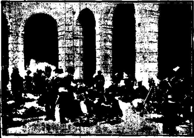
w zdobytym przez rząd kościołach biwakuje wojsko