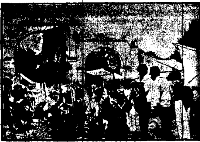
nieustające procesje brnią kościół przed okupacją władz