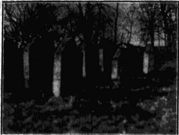
Groby Tatarów warszawskich na cmentarzu mahometańskim w Warszawie.

W roku 1812, kiedy nad Polską wiał wiatr zdradziecki — wiosny ludów —