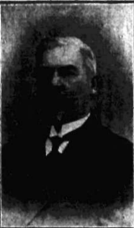
SENATOR A. ACHMETOWICZ Jedyny muzułmanin, Tatar polski w Senacie Rzeczypospolitej polskiej.