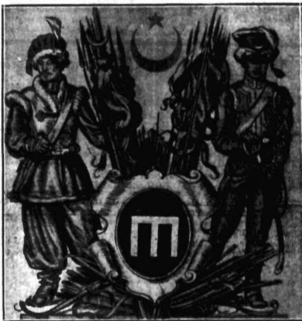
Herb polski jednego z najznamienitszych książęcych rodów tatarskich w Polsce — Talkowskich, (według rysunku J. Hopena w dziele „Herby rodzin tatarskich w Polsce” St. Dziadulewicza).

Podania należy składać do dn. 10 marca w sekretarjacie Syndykatu.