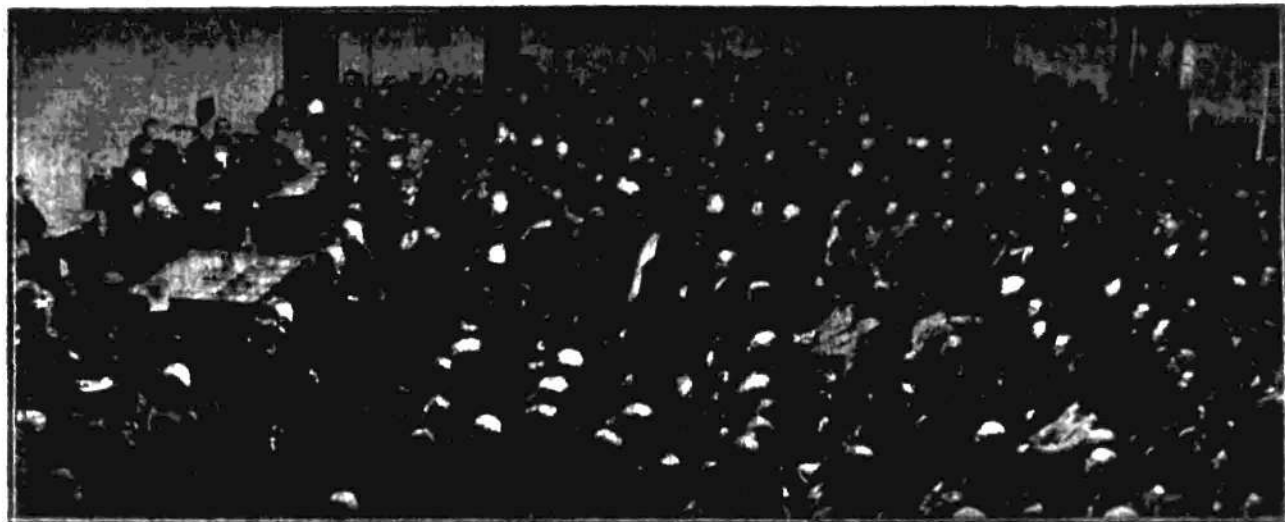
Otrzymała manifestacja w obronie religji, prześladowanej przez Sowiety w sali warszawskiego Towarzystwa Higienicznego.