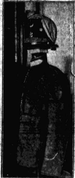
MUNDUR JAZDY Tatarskiej w.P. zorganizowanej w myśl stawniej tradycji walk powstańczych w r. 1920.

lonji, mają się rozpocząć prace nad wzniesieniem świątyni, tymczasem zaś wszystkie uroczyste nabożeństwa odbywają się w lokalach prywatnych.