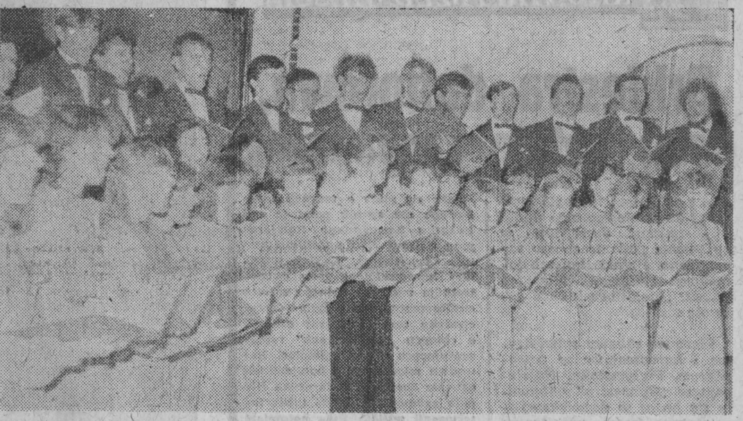
Chórzyści w całej okazałości.