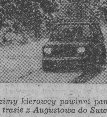
Mimo wroków zimy kierowcy powinni pamiętać o trudnych warunkach drogowych. NA ZDJĘCIU: na trasie z Augustowa do Suwałk.