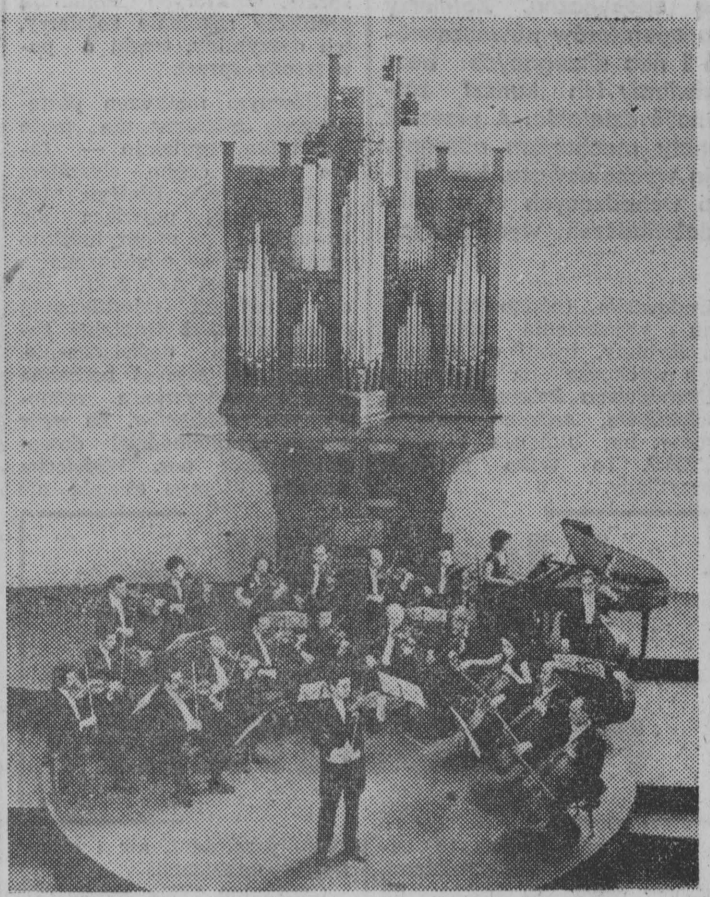
Przez najbliższe dni spotykać się będziemy w całym kraju z niejednym przejawem sztuki artystów ze Związku Radzieckiego. Nie zabraknie muzyki i to w najlepszym wykonaniu. Łomzyńskie komitety PRON i urzędy gmin, które potrafiły pozyskać dla „zielonych inwestycji” młodzież szkolną. Czynnym udział biorą także kółka rolnicze, kółka ZMW, ZSMIP, KGW, drużyny harcerskie i załogi poszczególnych zakładów pracy. Najlepiej spisali się dotychczas gminne szkoły zbiorcze w Czyżach i Hajnowce, kółka...