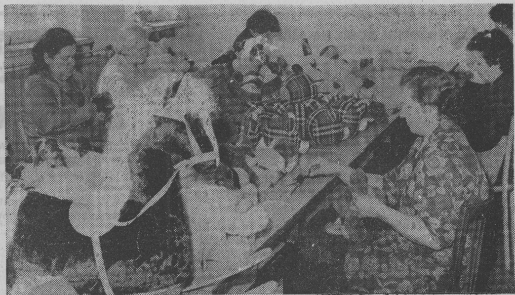
Dekoratorzy przy pracy.