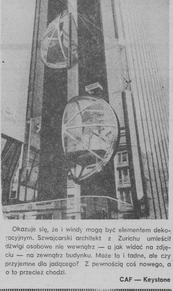
Okazuje się, że i windy mogą być elementem dekoracyjnym. Szwajcarski architekt z Zurichu umieścił dźwigi osobowe nie wewnątrz — a jak widać na zdjęciu — na zewnątrz budynku.

Ogłoszenia typu: przyjmujemy pracowników, poszukujemy pracowników, zatrudnimy pracowników — stają się w Czechosłowacji codziennością.