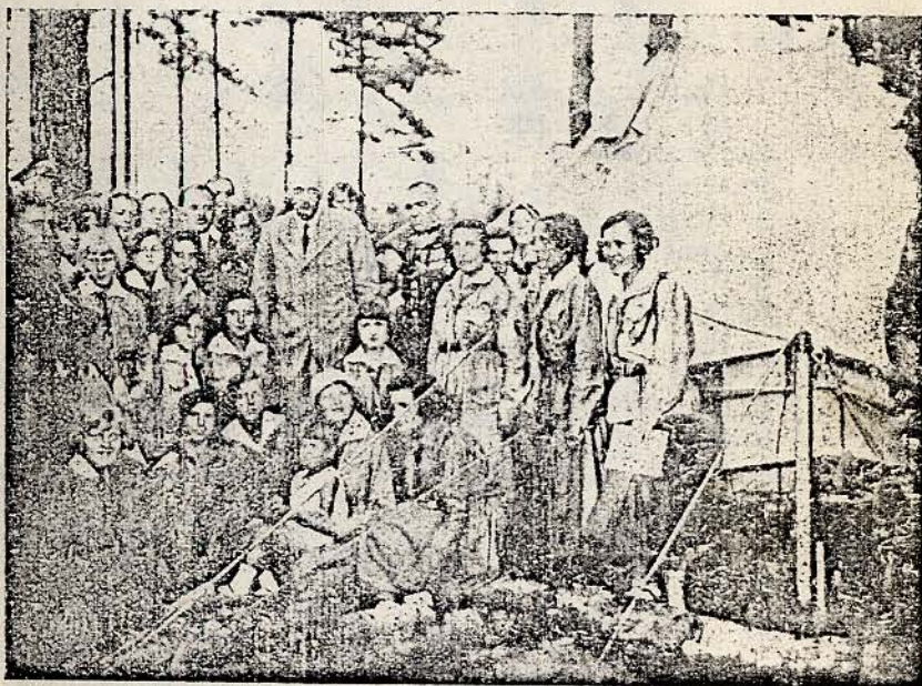
Pan Prezydent R. P. w obozie harcerzek nad jeziorem Białem pod Augustowem lipiec 1932 r.

B I A Ł Y S T O K , S T Y C Z E Ń — 1 9 3 3