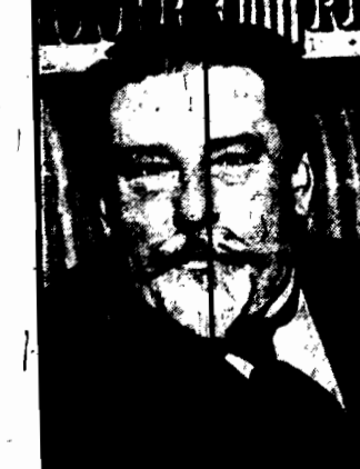
Prezydent Rzeczypospolitej lotewskiej polecił utworzenie nowego rządu postępu na Sejm, przedstawił więc postać demokratycznego, Juroszewskiego.