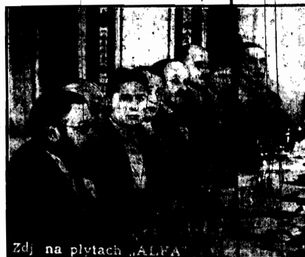
Zdjęcie na płytach „ALFA”

Owczaj wieczorem odbył się w salonych hotelu Europejskiego bankiet, wydany na cześć Alberta Thomasa przez Towarzystwo badania zagadnień między narodowych oraz Tow. przyjaciół Ligi Narodów. Po bankiecie odbył się rauc. Na zdjęciu pierwszy po lewej p. Albert Thomas.