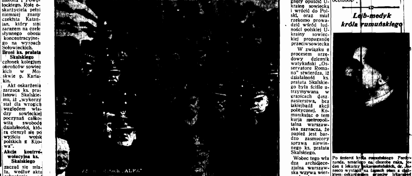
Na nabożeństwie w kościele św. Krzyża w Warszawie za zmarłych uczestników powstań styczniowych obecni byli przeważnie przedstawiciele wojskowości oraz dość liczna grupa uczestników wojny z 1863-go.