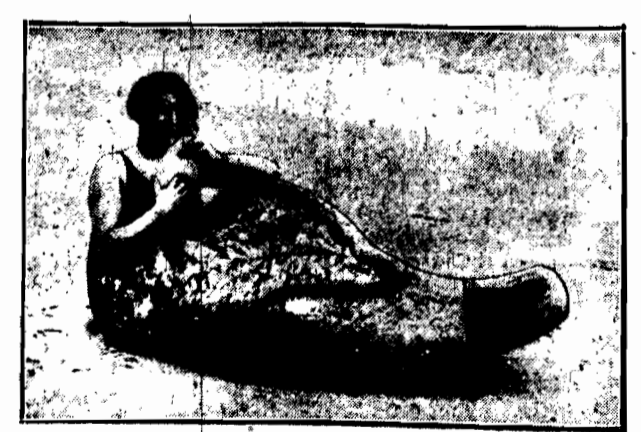
Zam zamiast beczki, panofela — obrzym. Mnieć może wymowny ale za to o wiele więcej wdzianka od słynnego meża stanu starożytnego Grecji