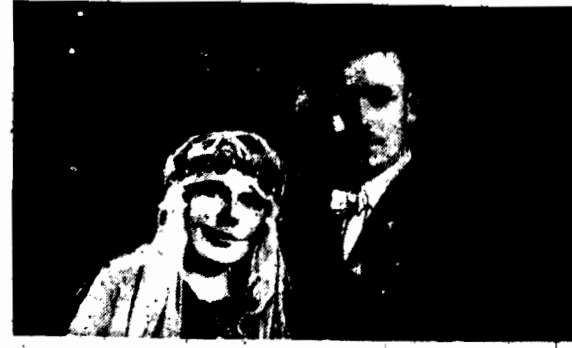
Tego samego dnia i w tym samym miejscu się urodził, tego samego dnia był ochrzczony, spowiadali się i komunikowali. Zetknęli się wreszcie w 29-letniej siołce i pobrali się. Czy można marzyć o lepszym harmonii małżeńskim?