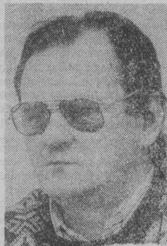
Rozmawiał: STANISŁAW FIEDOROWICZ