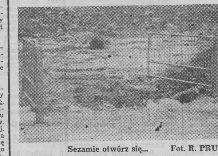
Sesamie otwórz się...