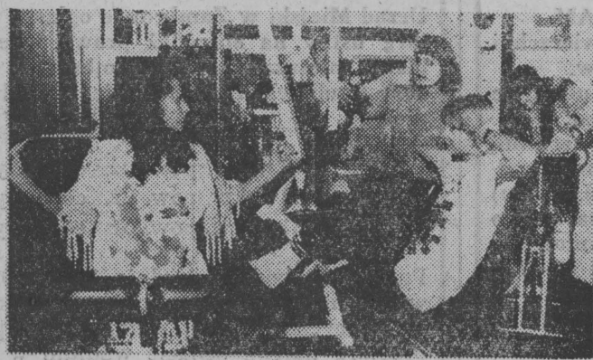
Prawidłowy rozwój fizyczny kadetek jest podstawą do sukcesów. Trening w Studium Doskonalenia Sylwetki.